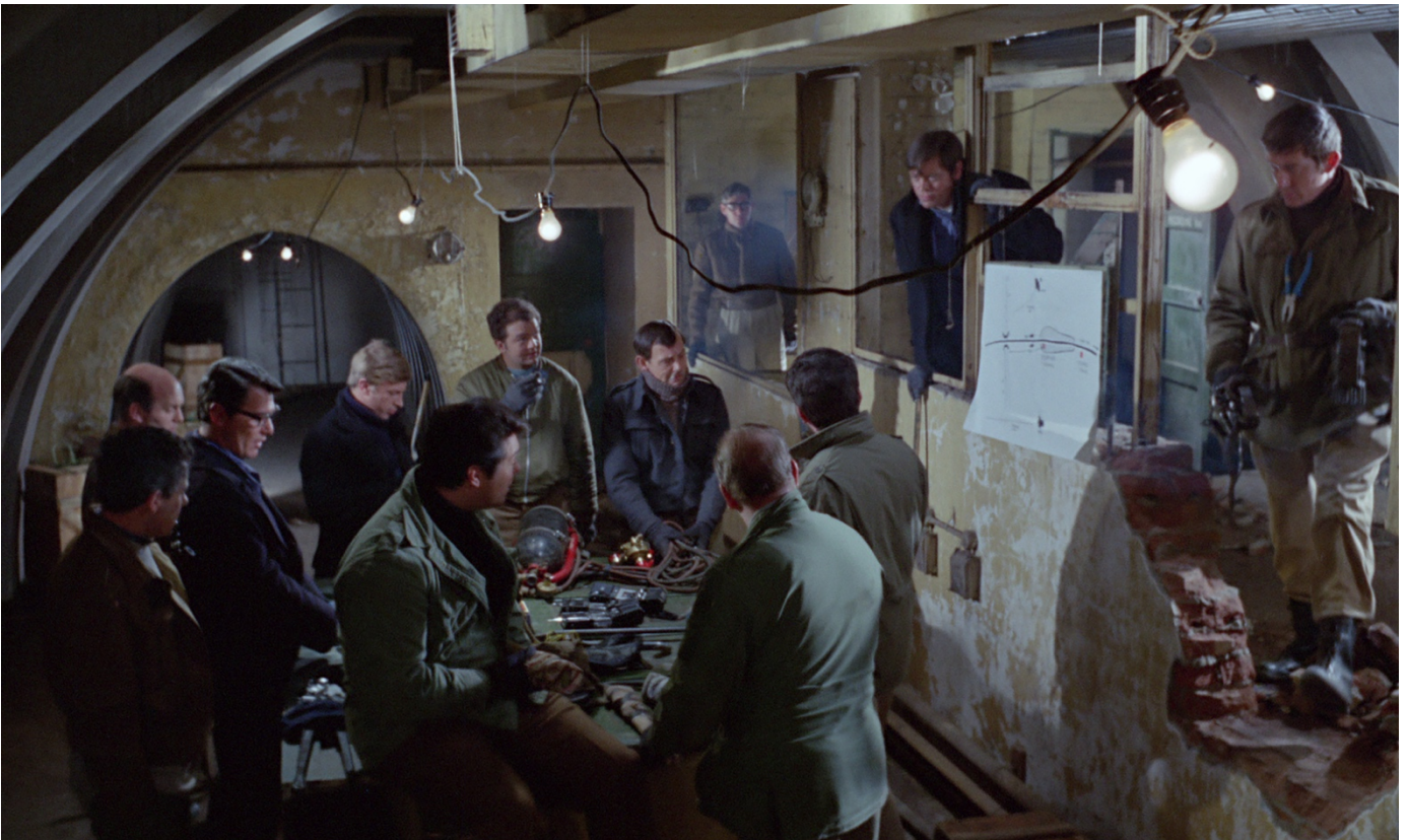
La planque du gang de Trois milliards d'un coup

En 1982, après avoir passé quatorze ans aux États-Unis, Peter Yates revient en Angleterre pour tourner Krull , un space opera avec Ken Marshall et Freddie Jones qui connaît un nouvel échec. Suit The Dresser (1984) avec Albert Finney et Tom Courtenay, le portrait d'un vieil interprète de Shakespeare à la mémoire défaillante qui mélange Lear et Othello et l'analyse subtile de ses rapports avec son habilleur. The Dresser comme Breaking Away valant à Peter Yates d'être nommé encore une fois à l'Oscar du meilleur film et du meilleur réalisateur.