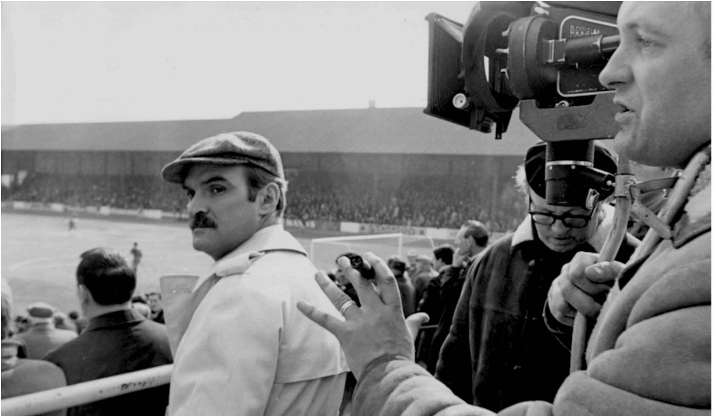
Brisbane Road (stade de l'équipe Leyton Orient) Stanley Baker, Douglas Slocombe et Peter Yates

En 1967 il va attirer l'attention avec Trois milliards d'un coup en reconstituant la préparation et l'exécution du hold-up du siècle : l'attaque du train postal Glasgow-Londres.